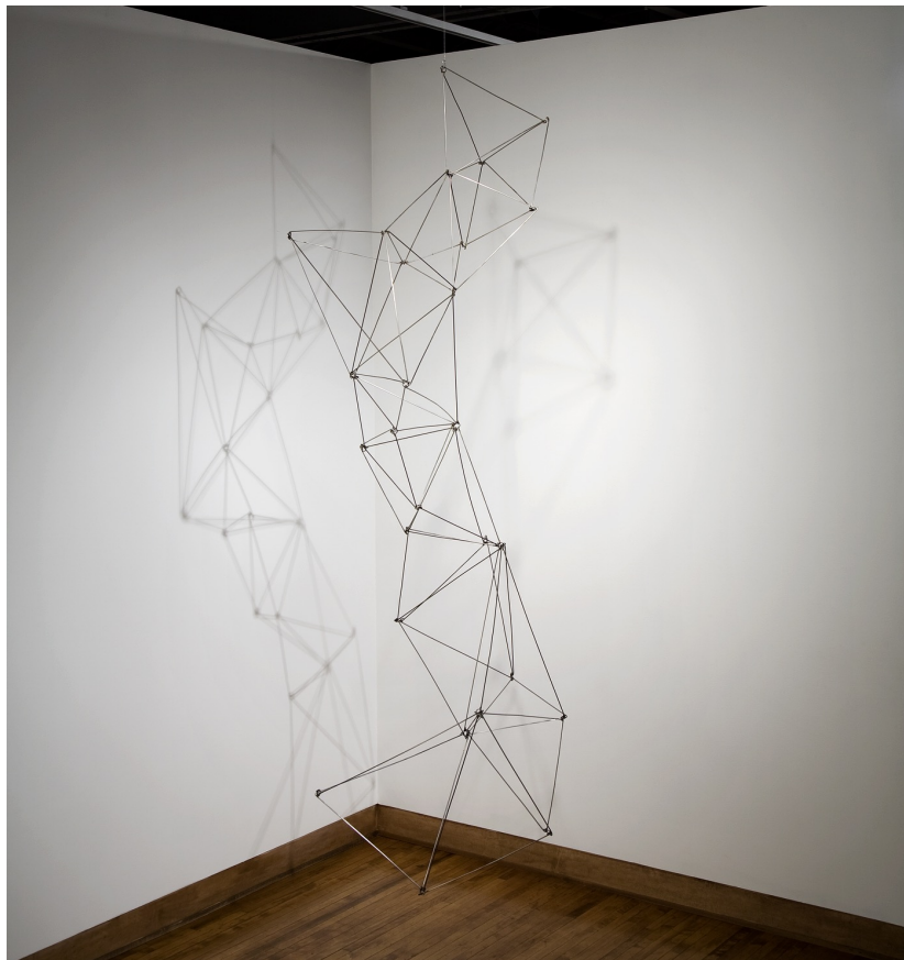
AUTOR IMAGEN: DEEDEE DE GELIA. © FUNDACIÓN GEGO